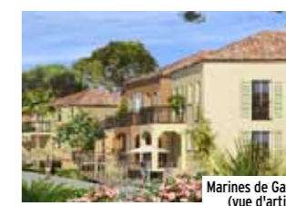
Marines de Gassin (vue d'artiste)

Deux projets sont en cours : celui de la Vernatelle et celui des Marines de Gassin. Aux Marines de Gassin, le permis de construire des futurs logements vient d'être signé. Les travaux devraient commencer d'ici la fin de l'année. Les élus ont d'ores et déjà choisi un projet "à taille humaine". 32 logements pour actifs verront le jour dans de petits immeubles ne dépassant pas un étage. Tous seront dotés d'espaces verts. A l'issue de