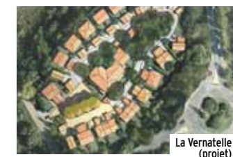
La Vernatelle (projet)

Un bus est à la disposition, une fois toutes les 2 semaines, des habitants qui n'ont pas de véhicule et des personnes à mobilité réduite pour se rendre dans la plaine afin de faire leurs courses.