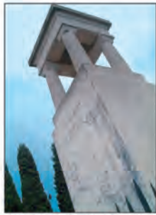
Gassin : le monument aux Morts

Is n'ont pas gagné mais ils ont participé. N'est-ce pas l'essentiel ? Surtout lorsqu'il s'agit de réfléchir sur un sujet de notre histoire proche : la Résistance et la déportation. Comme de nombreux lycéens de leur âge, ceux du lycée du Golfe ont participé au récent concours national de la Résistance et de la Déportation, dont l'objectif est d'en "perpétuer chez les jeunes français le souvenir afin de leur permettre