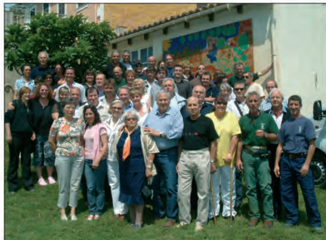
Déjeuner des élus et du personnel communal

caire, toutes deux bénévoles. Après un apéritif au soleil, tout le monde a déjeuné sous des auvents. Le maire a remercié "tous ceux avec qui (il) travaille depuis de nombreuses années. Nous oeuvrons tous avec le même objectif, a-t-il précisé, le bien-être de Gassin et des Gassinois".