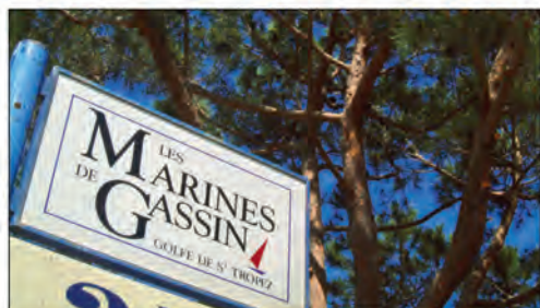
Un relais Poste au "Ciao Café, Ciao Belli"

La mairie et La Poste ont négocié l'ouverture d'un