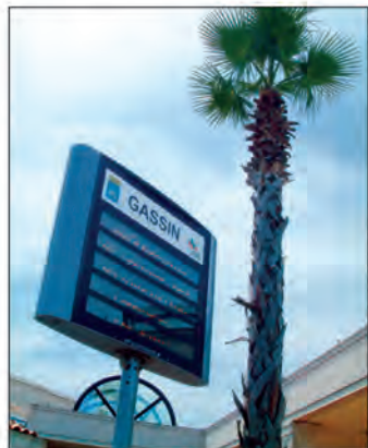
Aux entrées principales de Géant

Depuis août dernier, la commune a fait installer deux journaux lumineux mis en place sur deux sites stratégiques aux entrées principales de Géant La Foux. Ces panneaux informent tous les jours la clientèle nom-