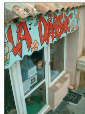
Un service au cœur du village