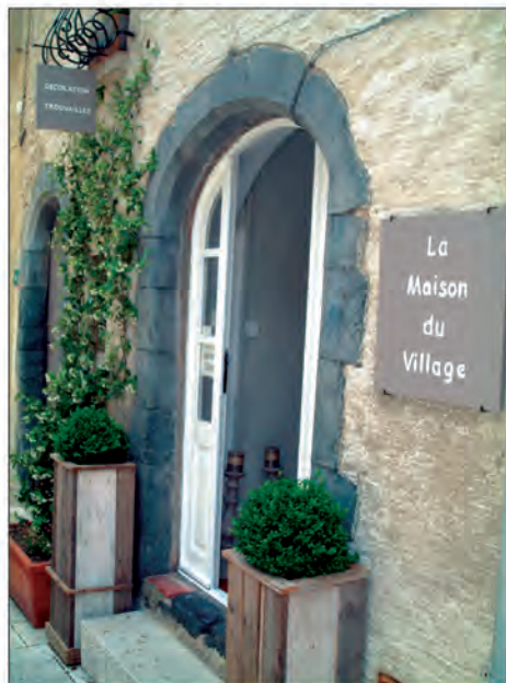
Pour les amoureux de pure déco

Voilà un nouveau lieu qui ravira les connaisseurs et les amoureux de pure déco. Surtout pas une boutique traditionnelle mais un espace où chaque objet a été choisi avec plaisir et raffinement. Des marques rares et réputées (Bougies Trudon -ex Manufacture Royale de Cire- cires naturelles entièrement végétales et biodégradables aux senteurs inspirées de l'Histoire de France et une "odeur de Lune", un parfum métallique retour de l'Espace !) La collection d'assiettes et de bols "Regards" du créateur Jean-Baptiste Astier de Villate, Linge Linum, Vox populi, Du Bout du Monde, mobilier en bois et des trouvailles comme une ancienne et authentique malle Vuitton. 6, rue centrale.