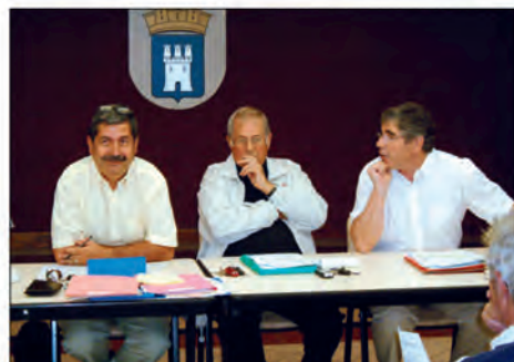
Hélicoptères : les trois communes mobilisées

Mieux vaut prévenir que guérir. A la demande de Madame le Sous Préfet, les maires des trois communes de la presqu'île Gassin, Ramatuelle et Saint-Tropez se sont rencontrés afin de trouver une solution pérenne au problème posé par la desserte hélicoptérée de la presqu'île. Les maires se sont accordés pour affirmer qu'ils ne souhaitent pas d'hélistations implantées sur leur territoire. Par contre, la solution de leur situation en mer sur des barges est souhaitée. Une étude doit être réalisée portant sur les répercussions du bruit, les restrictions qui pourront être