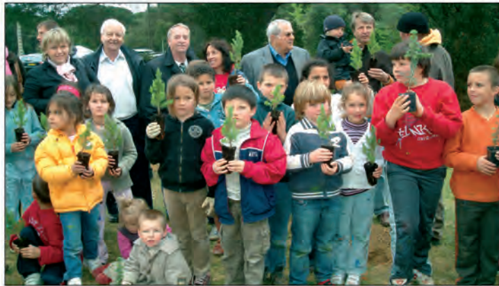
Nos enfants mobilisés pour prendre soin de la Terre

(Suite de la Une) les enfants du centre de loisirs ont planté chacun un arbre, eucalyptus, pin parasol ou arbre de Judée, avec l'aide des jardiniers de l'entreprise gassinoise JEV Derbez et des élus. Les arbres plantés ont été comptabilisés dans la campagne mondiale pour un milliard d'arbres du Programme des Nations Unies pour l'Environnement : "Plantons Pour la Planète". Le PNUE est la plus grande