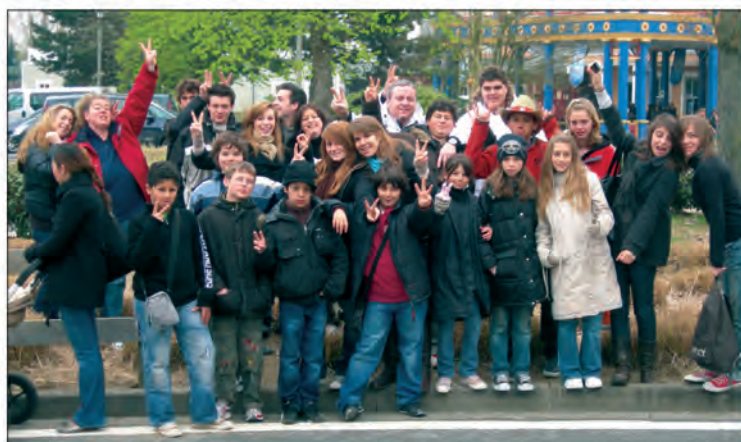
Un centre de vie où nos ados créent, s'amusent et se construisent au contact des autres

que d'autres municipalités de la presqu'île participent à la même démarche et complètent avec leurs propres offres, celle de Gassin. Nautisme, plongée sous-marine, bouée tractée, randonnée pédestre, skate, cinéma aussi, quad, spéléo, voile, jeux vidéo en réseau mais aussi pratique du speed-ball, de la crosse québécoise, de la balle de tambourin, base-ball, jet, planche, kayak... mais encore sorties plus lointaines comme des bivouacs durant une semaine dans le Verdon ou un séjour à Paris chez Mickey... La plupart des activités sont gratuites. D'autres sont prises en charge par la commune avec ou sans participation des familles. Voilà un centre de vie où nos ados se retrouvent, créent, s'amusent, apprennent et se construisent au contact des autres. Info sur place ou par téléphone : 04 94 56 53 48. Rue de l'Aire.