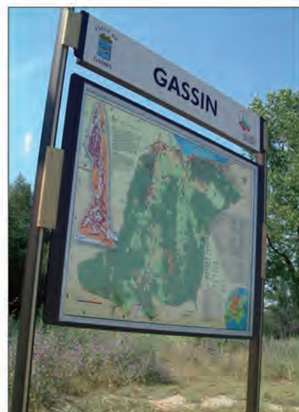
Montée de Coste Brigade

et déjà prévus. Le plan-guide sur papier de la Commune est en cours de réimpression. Gratuit, il sera disponible notamment en mairie, à l'office de tourisme de la Foux, chez les commerçants et, l'été, au Foyer des campagnes. Enfin, comme vous le constatez avec ce document entre vos mains, la Commission Communication a choisi une nouvelle lettre d'information au format et à la pagination plus