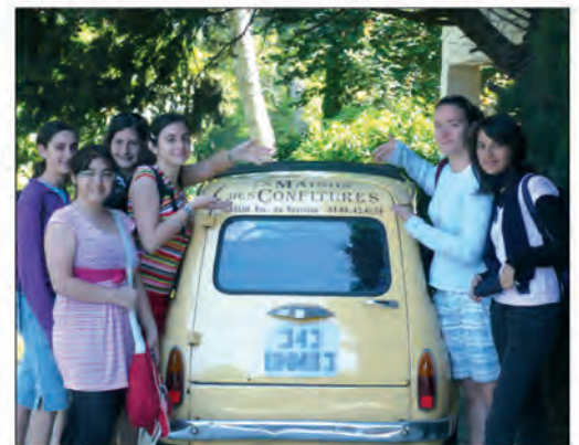
En visite à la Maison des Confitures...