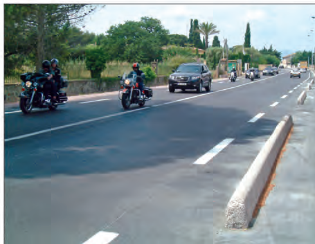
... Est-ce la meilleure solution ?

(Suite de la Une) le bien-fondé de ces travaux destinés à renforcer la sécurité sur cet axe particulièrement dangereux (17 accidents mortels en 2006), Yvon Zerbone a toutefois fait observer que la réduction des deux voies principales risquait "d'empêcher les camions des sapeurs-pompiers et des secours, lorsqu'ils auront à remonter les bouchons par le milieu,