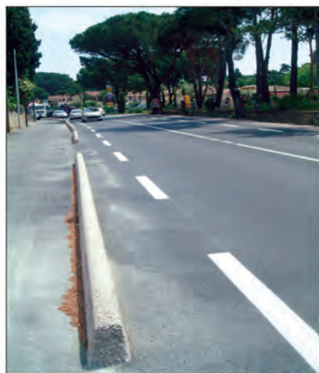
RD 98 : cinq niveaux de circulations...

(Suite de la Une) le bien-fondé de ces travaux destinés à renforcer la sécurité sur cet axe particulièrement dangereux (17 accidents mortels en 2006), Yvon Zerbone a toutefois fait observer que la réduction des deux voies principales risquait "d'empêcher les camions des sapeurs-pompiers et des secours, lorsqu'ils auront à remonter les bouchons par le milieu,