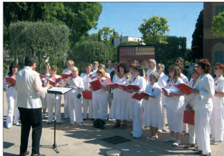
Nouveau rendez-vous avec la chorale Nikaïachor, le 22 juin