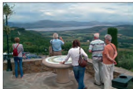
Autour de la table d'orientation

D ifficile de comptabiliser le nombre de touristes qui viennent marcher dans les ruelles de notre cité minérale et y découvrir un des plus