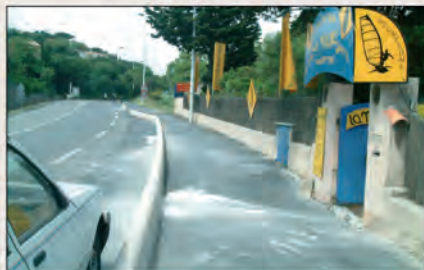
La Moune : des centaines d'adolescents depuis 1991

D ans le cadre des travaux de revêtement routier qui se déroulent sur la RD 98, et notamment dans les virages du Treizain, le maire Yvon Zerbone et les élus ont apporté leur soutien à l'école de voile de La Moune. Le schéma des protections envisagées sur le bas-côté devant l'entrée prévoit en effet la suppression de nombreuses places de parking ce qui pénaliserait durement l'activité de la plage. "Il existe bien un terrain