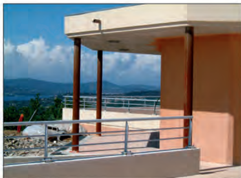
La prochaine école maternelle en chantier

Quelques mois de l'ouverture officielle de la nouvelle école maternelle, construite au cœur du village, les entreprises s'activent sur le chantier afin de respecter les délais et ouvrir dans les temps (septembre 2008). C'est le chantier le plus important actuellement sur la commune. Qui y a droit ? Comment s'inscrire ? Renseignements et inscription en mairie.