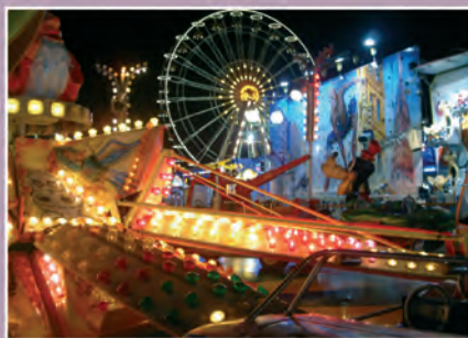
Sensations fortes pour petits et grands

Le chiffre paraît énorme et pourtant Azur Park reçoit en moyenne 700 000 visiteurs par an. Ce "quartier" de lumières et de sensations fortes qui éclaire autant qu'il anime le carrefour de La Foux propose 28 attractions pour petits et grands, un mini golf et un voyage au pays des dinosaures ! Il est ouvert tous les soirs d'avril à septembre.