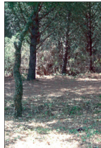
Il faut débroussailler !