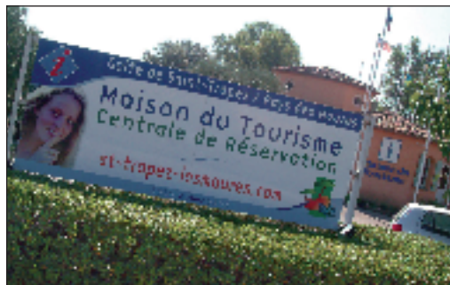
Centrale de réservation : un outil indispensable et un observatoire précieux pour les professionnels

COMME TOUS LES ÉTABLISSEMENTS de la presqu'île, hôtels et restaurants de la commune ont subi un début de saison plus difficile que l'an passé en raison d'une météo défavorable, certes, mais aussi d'une conjoncture incertaine. La maison du tourisme Golfe de Saint-Tropez/ Pays des Maures a enregistré une fréquentation nettement en baisse (-20% par rapport à 2007) avec une clientèle française (en provenance de Paris ou du Nord) moins nombreuse et plutôt dense depuis les régions Rhône-Alpes et Provence Alpes Côte d'Azur. Baisse également de la clientèle belge et hollandaise, égale pour les