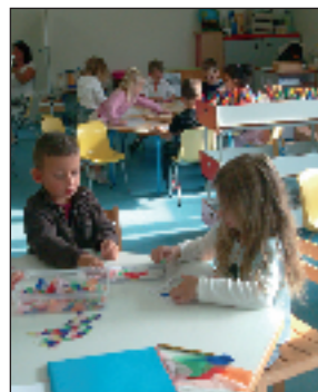
Sages... comme des images !

Un lieu d'apprentissage pour s'épanouir !