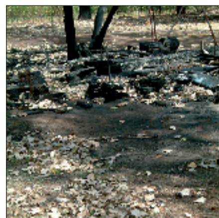
Après le passage du feu, un spectacle de désolation