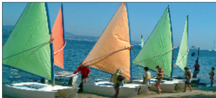
La Moune : une exposition idéale aux vents pour une formation adéquate

De juin à septembre, l'école de voile de la Moune ne désemplit pas. En début de saison, une centaine de jeunes scolaires viennent en car, de Gassin et de Ramatuelle, apprendre les rudiments de la voile, à raison de 8 à 10 séances en un mois.