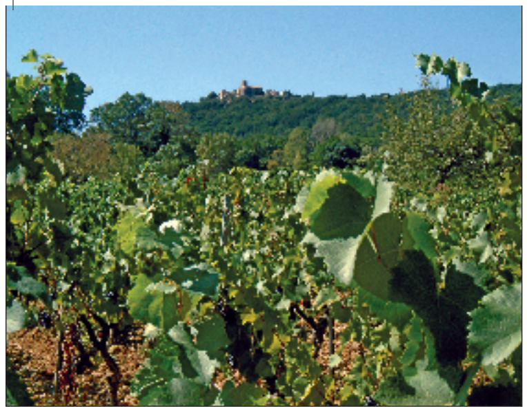
La viticulture : plaisir des yeux et des sens

belle, disent les experts, mais les quantités afficheront un volume équivalent. C'est vrai qu'après un hiver humide et quelques gelées, le printemps a été plus doux, les floraisons plus variables et plus étalées dans le temps. En été, la situation s'est largement améliorée permettant à la vigne d'évoluer de façon tout à fait satis-