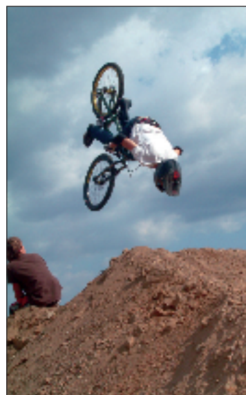
Le VTT, un sport... renversant !