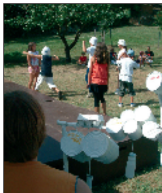
Spectacle final : des jeunes, acteurs et musiciens

Un centre aéré sous le signe de la musique