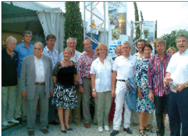
Un stand commun pour les 12 communes du golfe de Saint-Tropez