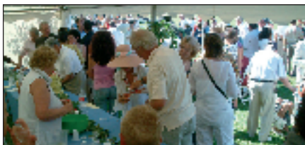
Un maillot d'or a été remis à l'équipe vainqueur.

POUR LES 20 ANS du Polo Masters Riviera, Jean-Yves Delfosse avait préparé un programme très festif (soirée tropézienne sur le port, sea, sun and assado, plage de Pampelonne, et, pour la finale, défilé de voitures anciennes et concours de chapeaux...) et bien sûr compétitions âpres entre joueurs internationaux. Au moment de l'apéritif, la tente de Gassin n'a pas désempilé.