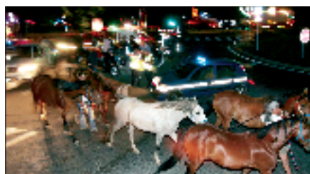
Dans la nuit, une caravane d'animaux apeurés...