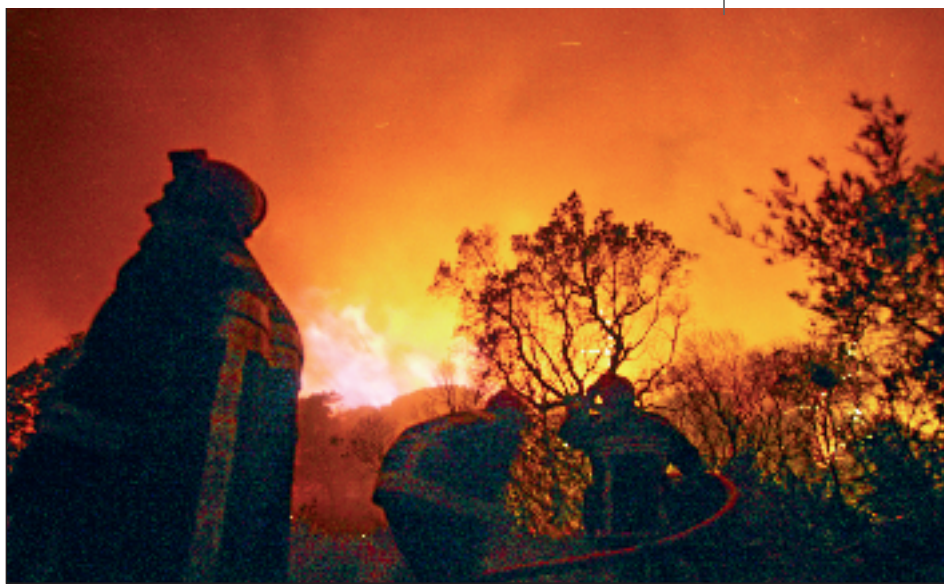
Une nuit rouge et or balayée par un violent mistral