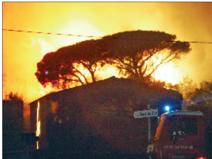
Le feu à La Mort du Luc : spectaculaire et « terrifiant »

"Dès le départ, a-t-il raconté, le comité feux de forêt a disposé ses hommes sur les différents axes pour guider les premières colonnes venant des communes voisines. Police et gendarmerie en accord avec les responsables des pompiers ont géré la circulation tandis que collègues