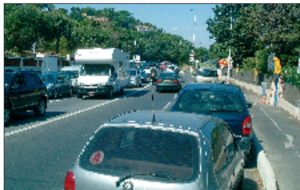
« Virages du Treizain : un axe routier toujours très dangereux ! »

De l'avis des autorités de gendarmerie et des sapeurs-pompiers, les travaux réalisés entre les virages du Treizain et l'entrée de Saint-Tropez n'ont pas fait baisser le