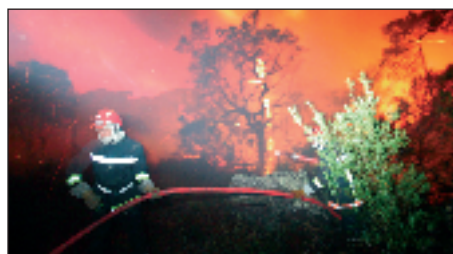
Un combat nocturne acharné